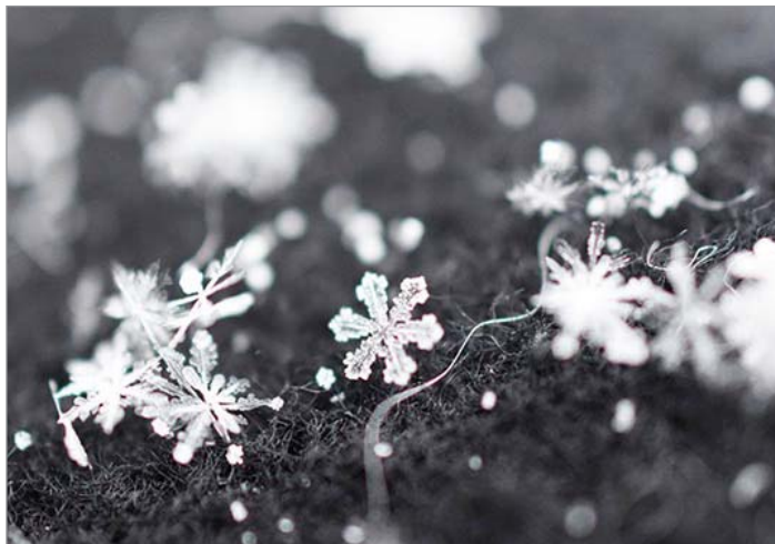
Снежинки в макросъемке