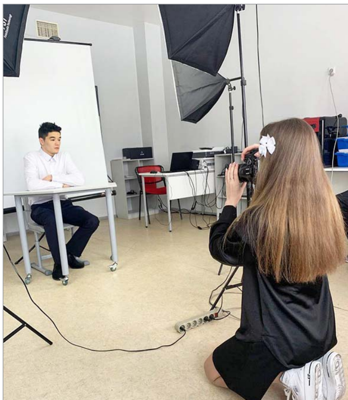
Студия на профессиональном уровне

ДТО тоже любит снимать природу, животных и движущиеся объекты. Как и мама, с фотоаппаратом редко расстаются, чтобы не упустить что-то важное. По списку «Ракурс» посещают двенадцать человек, а на самом деле приходят попробовать себя в качестве юного фотографа значительно больше девочек и мальчишек. Здесь о фотографии узнают все: от истории до навыков работы с современным фотоаппаратом. Такая школа – хороший старт для тех, кто всерьез нацелен на работу в медиа сфере. Педагог помогает каждому сформировать свое виденье, учит не только техническим премудростям, но и умению вкладывать смысл и идею в каждый снимок. Одним словом, почувствовать себя не только исполнителем, но и творцом с большой буквы. Под руководством опытной наставницы дети осваивают фотографию на ручных настройках, удивляя окружающих новыми фотошедеврами.