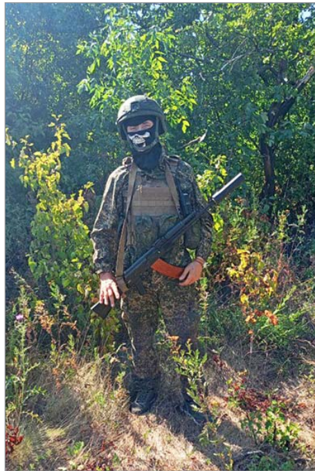
С боевого задания

— Я общался с нашими мобилизованными ребятами, приходившими в отпуск из зоны боевых действий, интересовался, что да как. Ну и, конечно, учитывая, что мои родные там, — принял решение идти на спецоперацию, — говорит собеседник. Распределили в батальон «Шторм», в разведывательно-десантную группу. Двенадцать бойцов отобрали в эту группу на выполнение особо сложных и важных боевых задач.