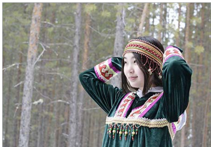
Работа в портретном жанре

– Этот опыт для ребят важен. На улице дети могут лучше фотоаппарат почувствовать, потренироваться с фоном, фокусировкой, что невозможно сделать в ограниченном пространстве кабинета. Могут посмотреть и понять, как себя ведёт объектив телевик на всю мощь. Помимо работы на пленэре, мы рассматриваем такие вопросы, как уход за оборудованием при резких перепадах температуры, использование камеры при различных погодных условиях, что тоже им непре-