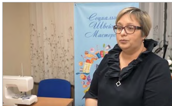
Страницу подготовила Надежда ЛУШКИНА.