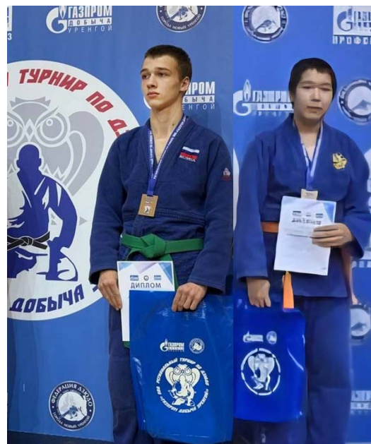
Разворот подготовила Надежда ЛУШКИНА.

Наши спортсмены проходят непростой путь – каждый к своей медали. Одни уже выигрывают, другие только начинают двигаться к значимым достижениям, но у всех без исключения упорства достаточно для покорения спортивных вершин. Ждём новых, ярких побед.