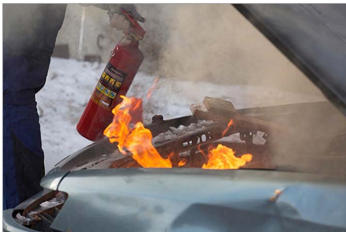
ПОМНИТЕ: автомобиль полностью выгорает за 4-6 минут!

ливаться в любом месте; возгорание в подкапотном пространстве, связанное с многолетним слоем отложения отработки на двигателе; ДТП; поджог.