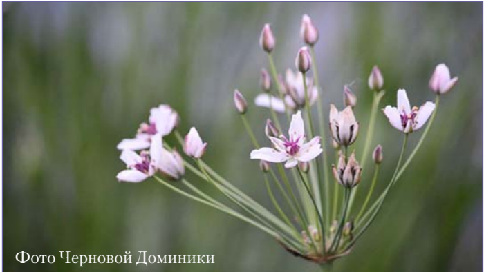
Фото Черновой Доминики