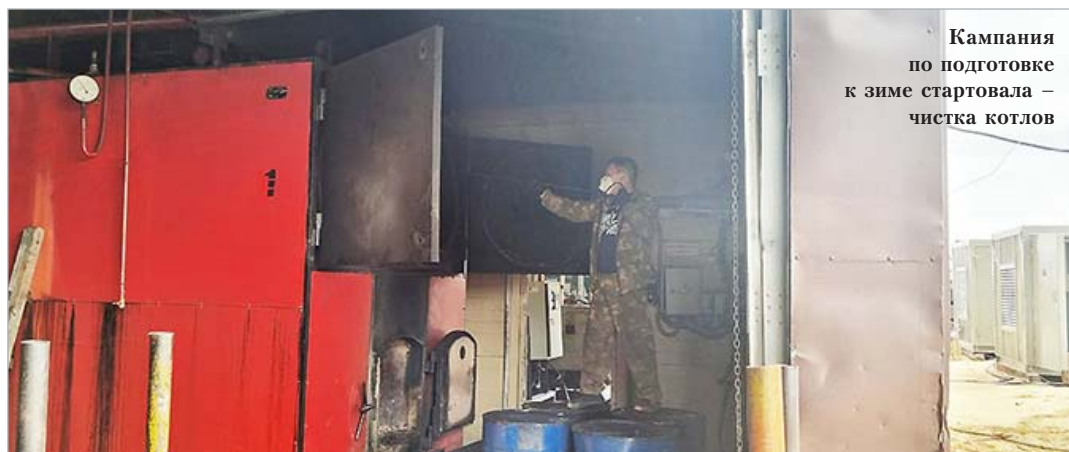
Кампания по подготовке к зиме стартовала – чистка котлов

вручную. Заготовка дров – процесс довольно трудоёмкий, затратный и даже появившийся недавно там древокол не многим облегчал труд работ-