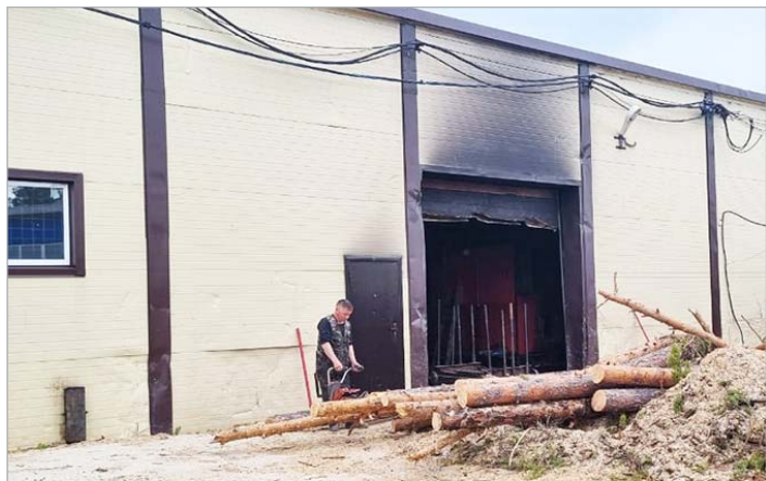
Дровяное топливо скоро останется в прошлом

Беседовала Маргарита ПЯК. Фото Светланы ЗАВОНОВСКОЙ, с. Ратта.