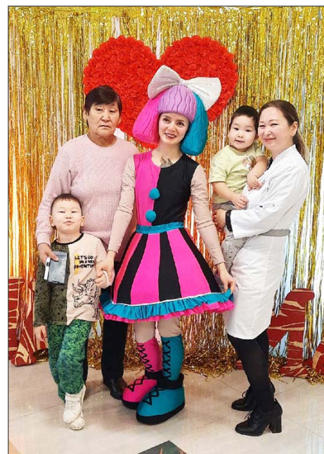
мам родительницам. День полон хороших сюрпризов, подарков, счастья».