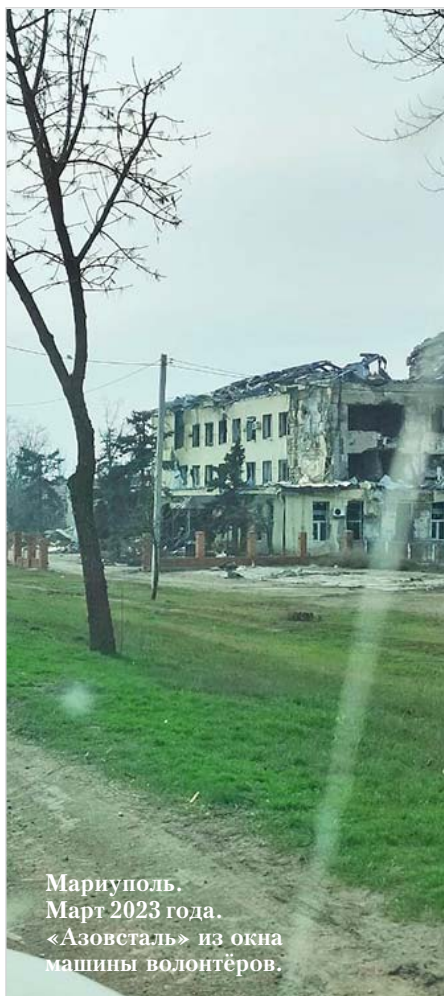
Мариуполь. Март 2023 года. «Азовсталь» из окна машины волонтеров.

райцентра на СВО. Съездив туда один раз, увидев реальную картину, я понял, что буду ездить туда и помогать, пока это всё не закончится, – уточнил активист.