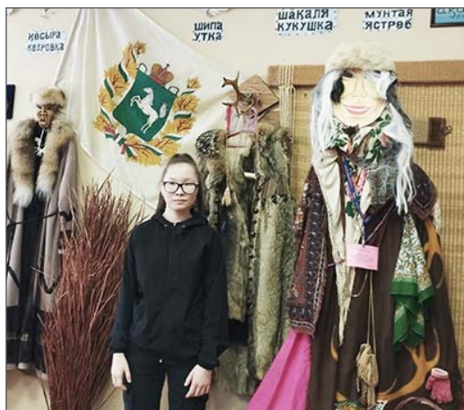
Перевод Анастасии КАЛИНОЙ, Любови ВАСИЛЬЕВОЙ.

Баяй сома тэтанты инан корасотын. Мэркы бумын сомакылың, пасибо.