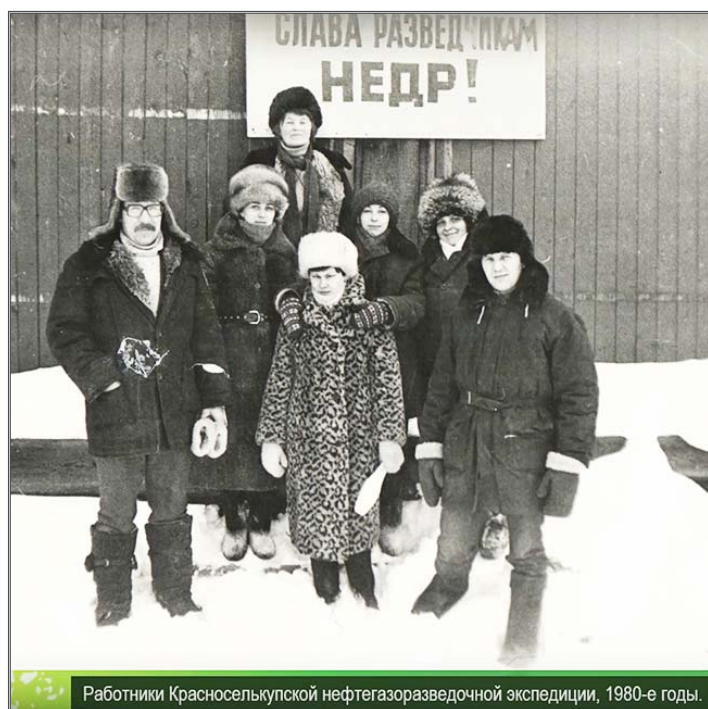
Работники Красноселькупской нефтегазоразведочной экспедиции, 1980-е годы.