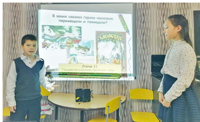
Даже по сказкам можно учить о правах ребёнка.

Родители воспитанников в тесном взаимодействии со специалистами, действуя в интересах детей, свои исследования в области правовой сферы решили посвятить Дню прав человека. Он отмечается 10 декабря с заявленной темой этого года «Равенство – сокращение неравенства, продвижение прав человека». Для всех родителей, желающих окунуться в исторические хроники, связанные с многолетней историей развития прав человека, специалистами Центра были подготовлены папки с лекцион-