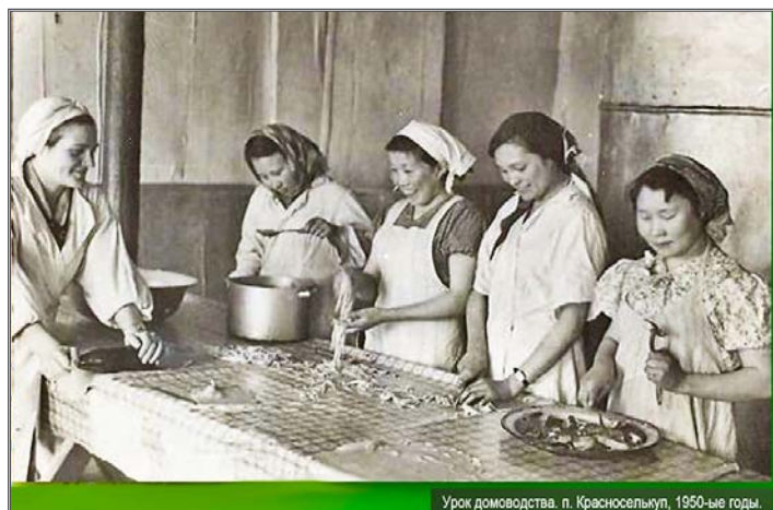
Урок домоводства. п. Красноселькуп, 1950-ые годы.