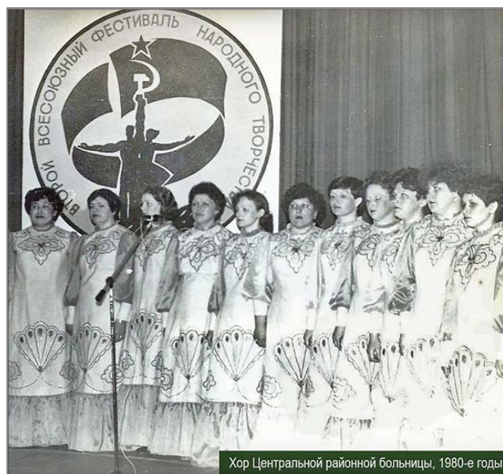
Хор Центральной районной больницы, 1980-е годы