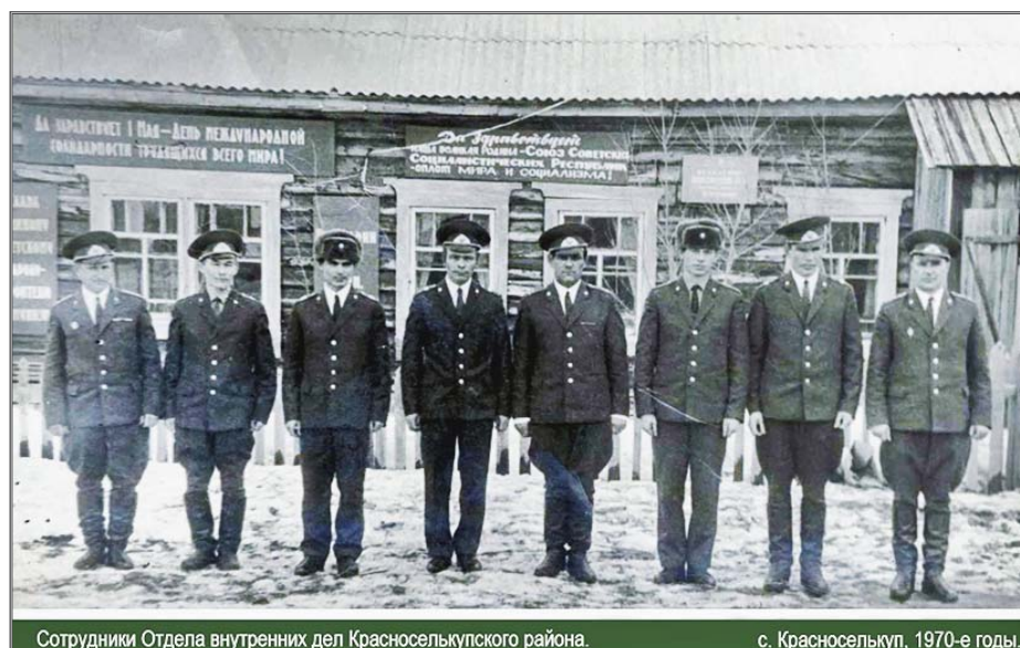
Сотрудники Отдела внутренних дел Красноселькупского района.