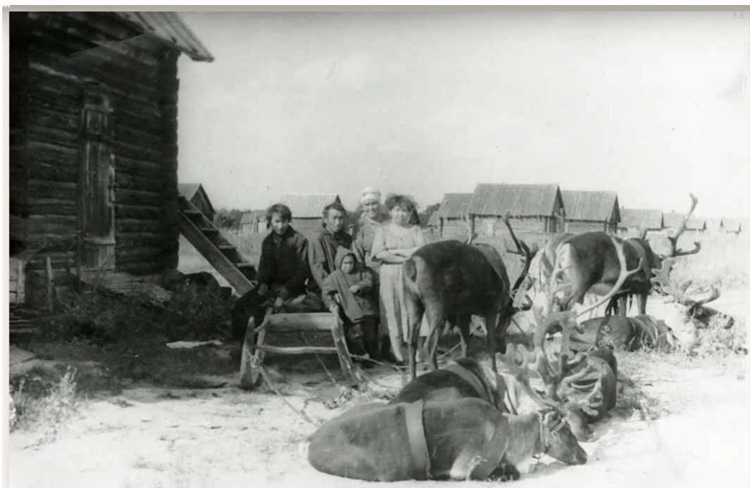
Жители п. Кикки-Акки, 1980-е годы.

10 декабря Ямало-Ненецкий автономный округ будет праздновать очередную дату со дня своего образования. В преддверии праздника мы продолжаем знакомить своих читателей с уникальной фотовыставкой, подготовленной Красноселькупским краеведческим музеем. Вспомним, с чего начинался путь становления северного округа, и, главное, людей, которые жили и делали историю красивейшего и этнокультурного полуострова. Сегодня в объективе – Кикки-Акки.