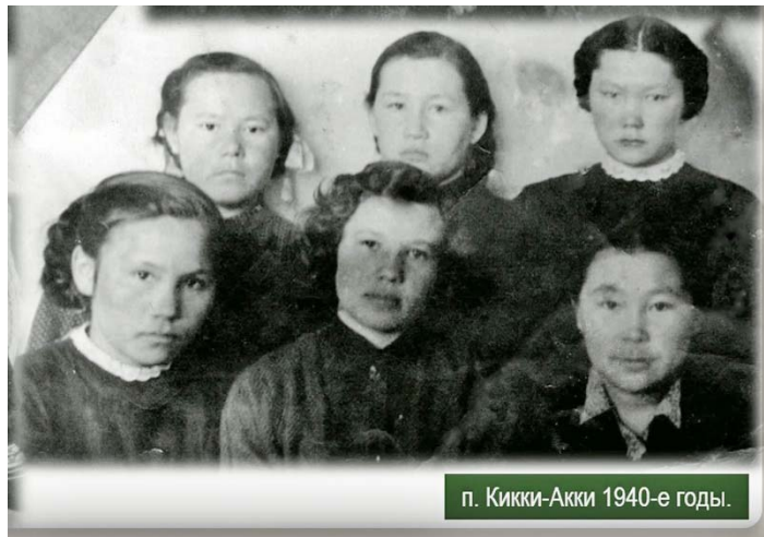
п. Кикки-Акки 1940-е годы.