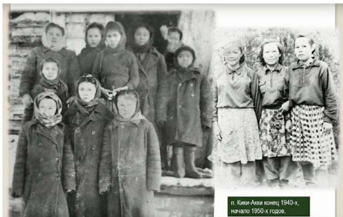
п. Кикки-Акки конец 1940-х, начало 1950-х годов.