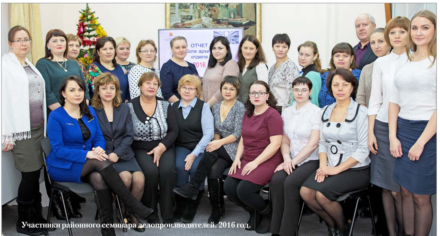
Участники районного семинара делопроизводителей. 2016 год.

Другая функция архива — комплектование. Это очень серьезный и ответственный вид работы, связанный со сбором документации, экспертизой ее исторической ценности и передачей в архив на постоянное или долговременное хранение. Источниками комплектования становятся организации, личные фонды граждан, фотодокументы, видеодокументы на