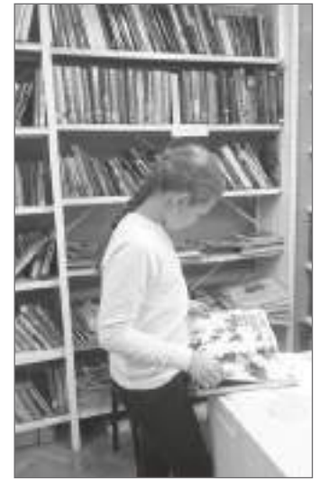
Интерес к книгам не угасает и у современных детей