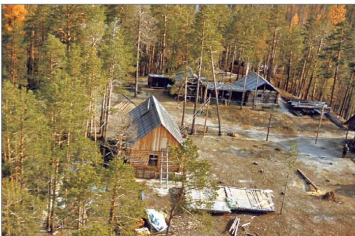
Кордон Верхняя Поколька, 1990 год