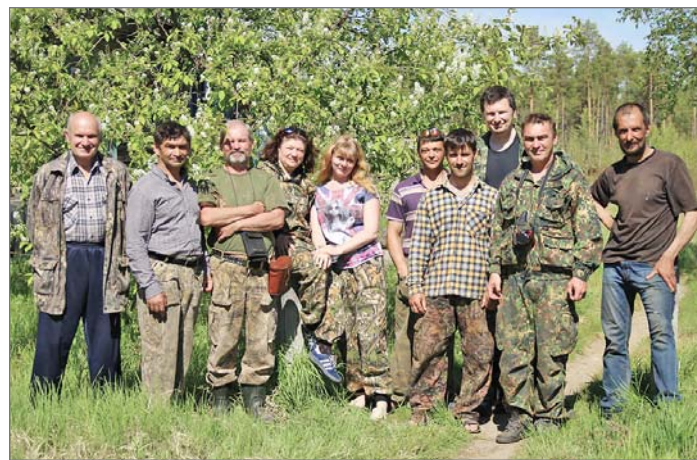
Коллектив ВТЗ, 2019 год

Постепенно укомплектовались штат заповедника, приехали специалисты, определи-