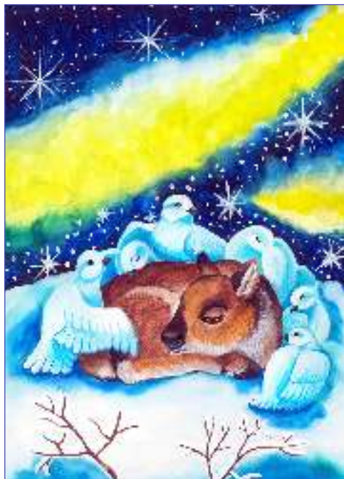
Евгения АНГЕЛОВА, «Сладкий сон оленёнка»