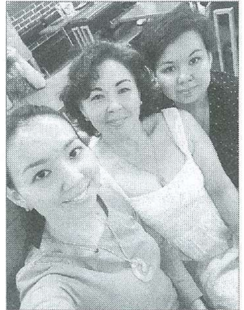
Счастливая мама (в центре) со старшими дочерьми

Все труды и достигнутые ими успехи не напрасны. Когда прихожу в местную школу искусств и вижу табличку с именем дочери на двери одного из кабинетов, душа моя радуется и ликует за то, что в далёком её детстве правильно поступила, не дав растерять заложенный в ней природой талант, – размышляет моя собеседница. – Интерес к музыке – это у нас семейное. Сама я раньше участвовала в хоре. Теперь же пою на клиросе в нашем сельском Храме, читаю на старославянском. Каждую беременность слушала музыкальную классику и, наверное, мои малышки ещё тогда влюбились в волшебные мелодии. С тех пор с музыкой неразделимы. В наших музыкальных вечерах уже и внуки вовсю участвуют.