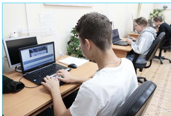
Для школьников округа реализуют проект «Кибердружина Ямала», направленный на обучение правилам интернет-безопасности.