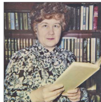
Начало 90-х годов.

В 70-80-е годы школа-интернат в райцентре по-настоящему была центром общественной и культурной жизни села.