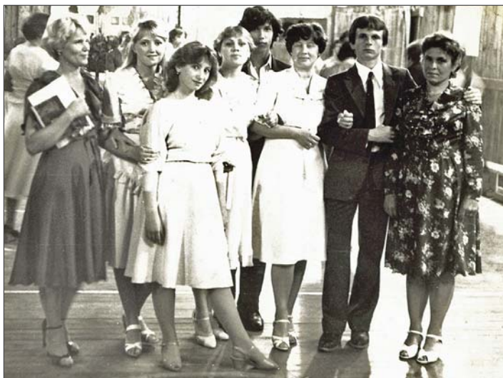
Выпуск 1984 года.