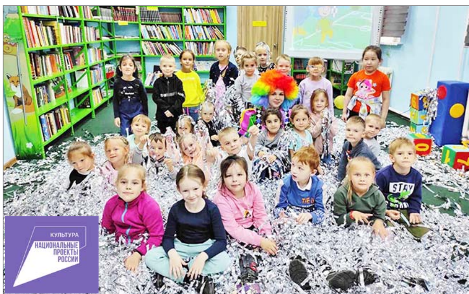
Детская библиотека – популярное место для культурного отдыха и самообразования красноселькупской ребятни. Скоро это пространство обретёт современный образ.

Беседовала Наталья МАТЯШ.