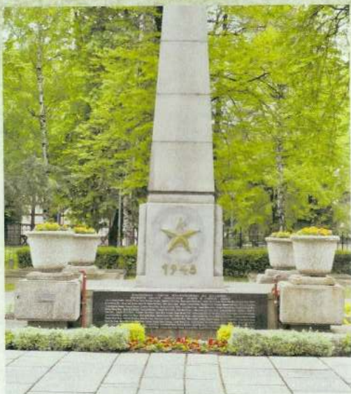
Кладбище советским воинам г. Явор, Польша