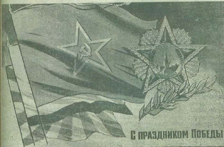
С ПРАЗДНИКОМ ПОБЕДЫ

Основана 3 сентября 1986 г. + № 38 (73) + СУББОТА, 9 мая 1987 года. + Цена 3 коп.