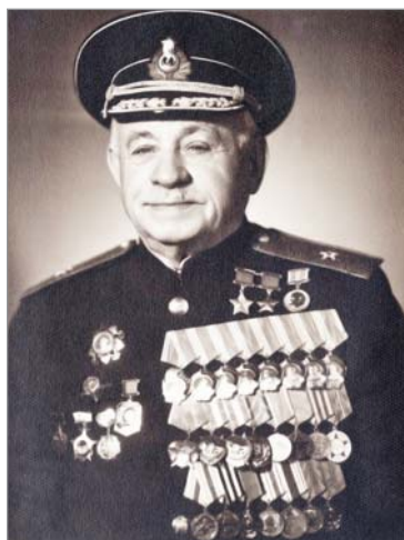
Иван Дмитриевич Папанин

Тяга к путешествиям началась с моего довоенного московского детства, с мальчишеской жизни с её «штабами», «разведками», с походов по Подмосковию. Именно тогда я понял: прав лорд Байрон, сказавший, что человек, который прожил жизнь в одном городе, прочитал только две строчки своей биографии. А поскольку я страстно полюбил путешествия, то после школы по-