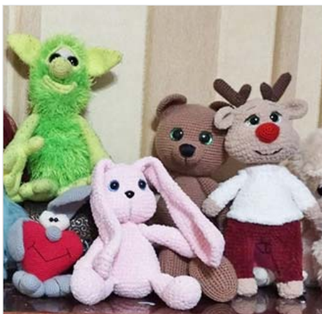
А, мама-то – рукодельница!